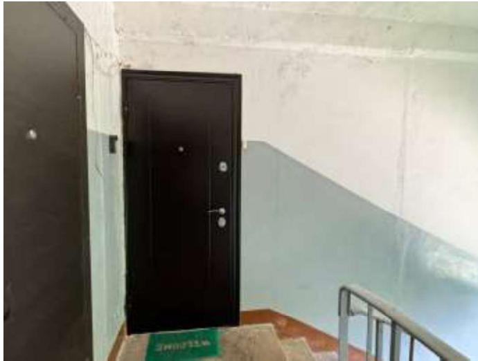
Dzīvokļa Nr.45 ārdurvis