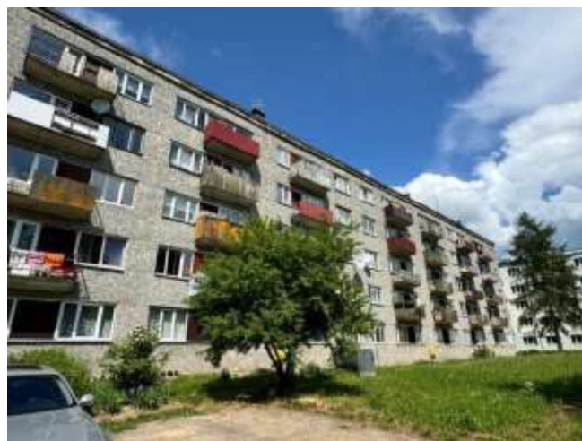
Dzīvojamā māja ar kadastra apzīmējumu 68680090563001, kurā atrodas vērtēšanas objekts